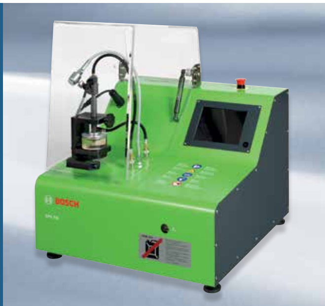
EPS 118: Plassbesparende og robust bordenhet med transparent kammer