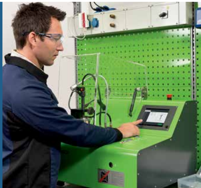
Enkelt å bruke med berøringsskjerm, også uten tidligere kunnskap om testing av dieselinjektorer

Andelen av common rail-systemer i dieselmotor fortsetter å øke. Den nye EPS 118 har presisjonsteknologi fra Bosch til en rimelig pris og gir også mindre verksteder muligheten til å delta på dette voksende markedet med minimalt utlegg.